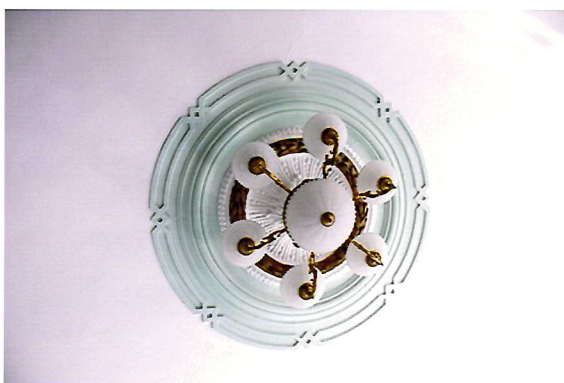
Видовая точка №16. Потолочная розетка. Помещение 2-го этажа.