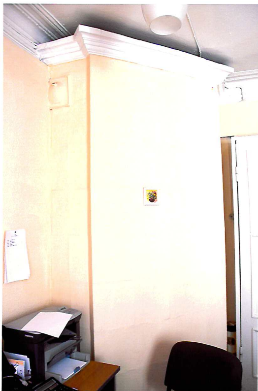
Видовая точка №10. Угловая изразцовая печь. Помещение 2-го этажа.