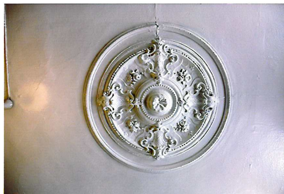
Видовая точка №15. Потолочная розетка. Помещение 2-го этажа.