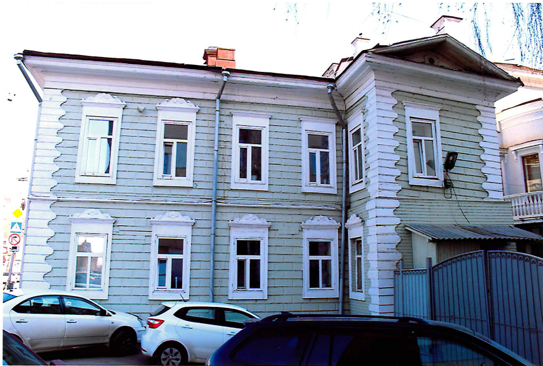
Видовая точка № 3. Южный фасад здания. дата снимка: 08.04.2016 г.