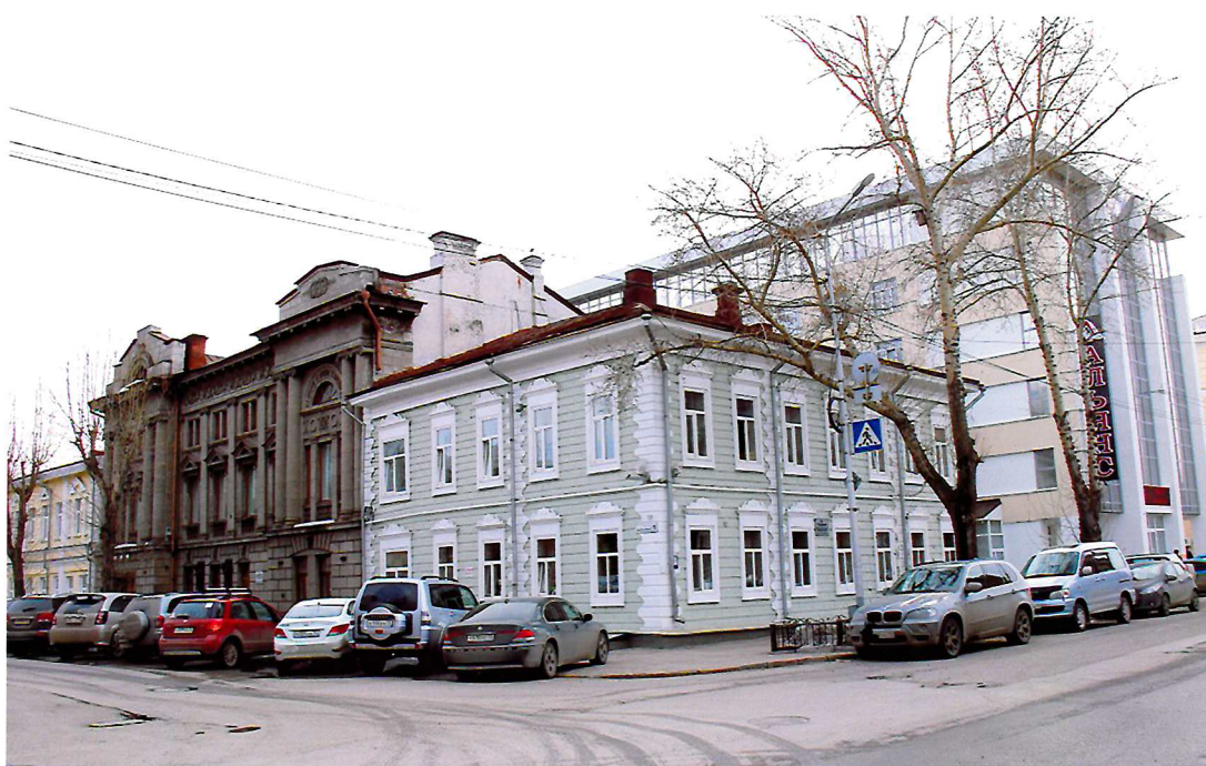
Видовая точка 1. Главный (северный) и западный фасады. Общий вид дома в строчке усадьбы с перекрестка ул. К. Маркса и пер. Кооперативного.

Фотографические изображения предмета охраны объекта культурного наследия регионального значения “2-х этажный жилой дом, 60 годы XIX в.”, “Здание, где впервые располагался Томский губком РКСМ в 1920 г.”, расположенного по адресу: г. Томск, ул. К. Маркса, 9