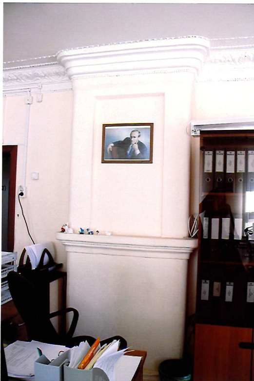
Видовая точка №8. Стеновая оштукатуренная печь. Помещение 1-го этажа.