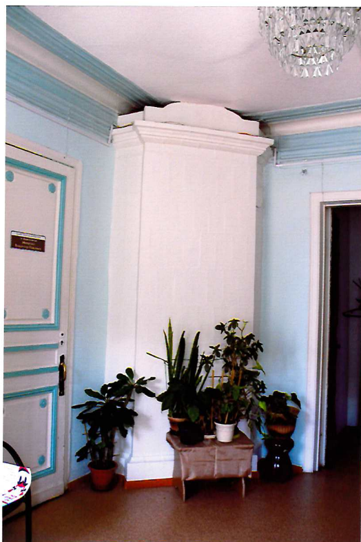
Видовая точка №12. Угловая изразцовая печь с фигурным завершением. Помещение 2-го этажа.