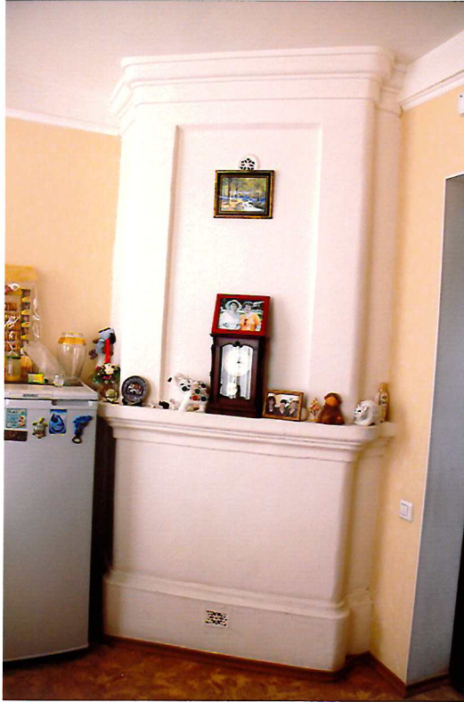
Видовая точка №6. Угловая оштукатуренная печь. Помещение 1-го этажа.

Автор снимков: А.Ю. Рыжикова, дата съемки: 25.05.2016 г.