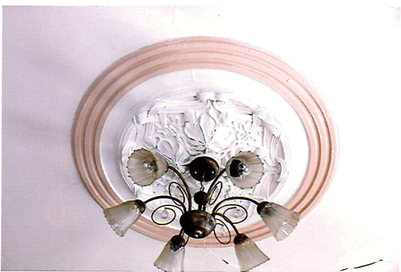
Видовая точка №18. Потолочная розетка. Помещение 2-го этажа.