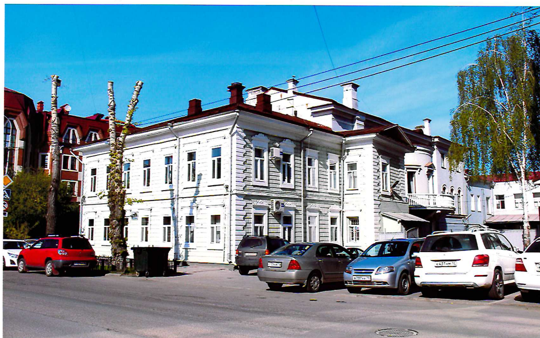
Видовая точка 2. Западный и южный фасады. Общий вид здания с ул. К. Маркса.