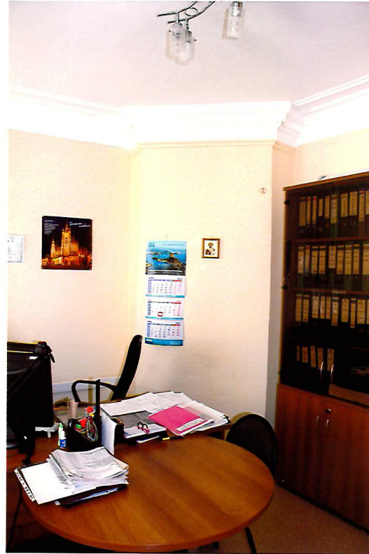
Видовая точка №7. Угловая оштукатуренная печь. Помещение 1-го этажа.