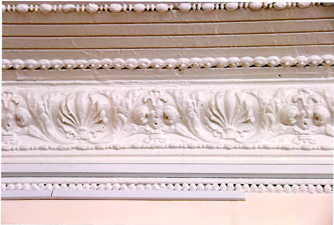
Видовая точка №21. Фрагмент потолочно-стеновой тяги. Помещение 1-го этажа.