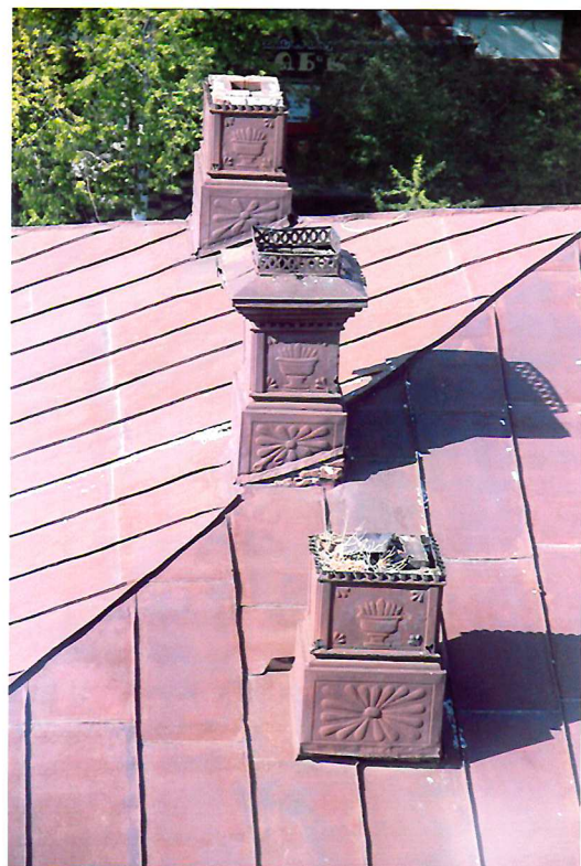
Видовая точка № 5. Печные трубы с оформлением. дата снимка: 19.05.2016 г.