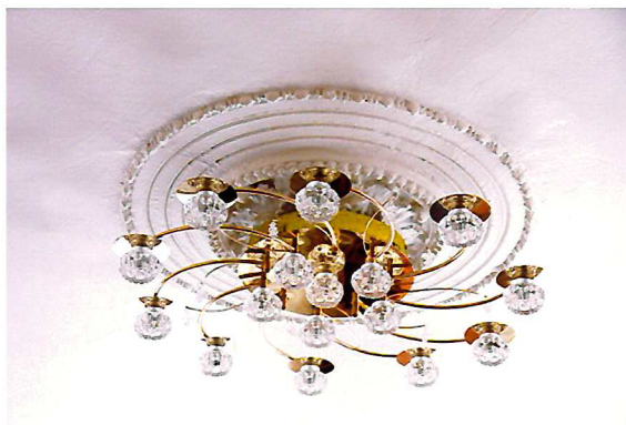
Видовая точка №14. Потолочная розетка. Помещение 1-го этажа.