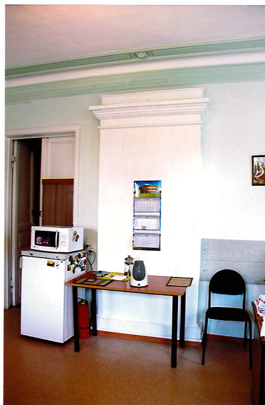
Видовая точка №11. Стеновая изразцовая печь с прямоугольным завершением. Помещение 2-го этажа.