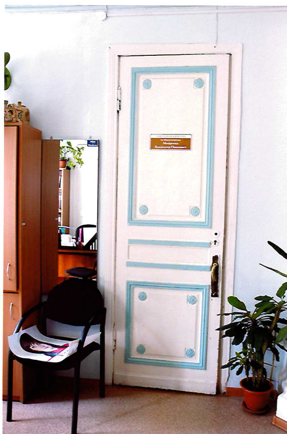
Видовая точка №20. Одностворчатая филенчатая дверь с накладным декором. Помещение 2-го этажа.