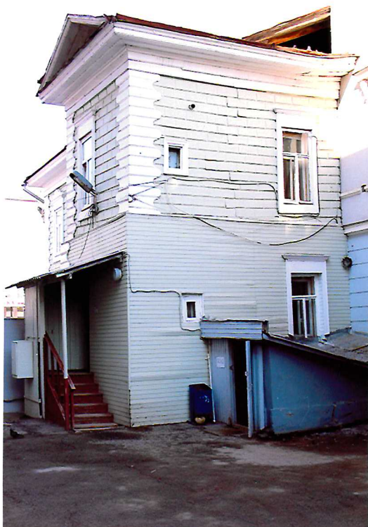
Видовая точка № 4. Восточный фасад здания. Вид со двора. дата снимка: 08.04.2016 г.