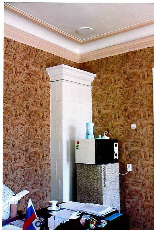
Видовая точка №9. Угловая изразцовая печь. Помещение 2-го этажа.