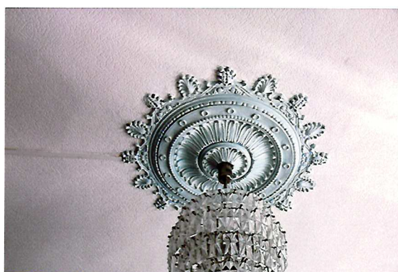
Видовая точка №17. Потолочная розетка. Помещение 2-го этажа.