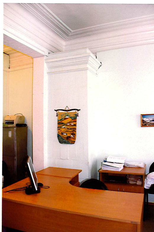
Видовая точка №13. Угловая изразцовая печь с прямоугольным завершением. Помещение 2-го этажа.