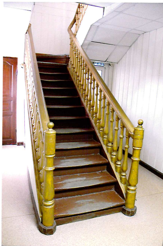
Видовая точка №22. Парадная лестница в уровне 1-го этажа.