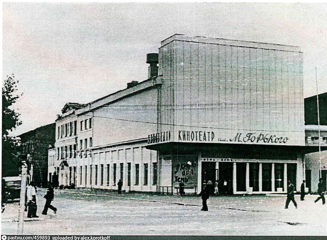
Кинотеатр им. Горького. Фото 30-40-х годов XX в.

pastvu.com/459893 uploaded by alex.korotkoff