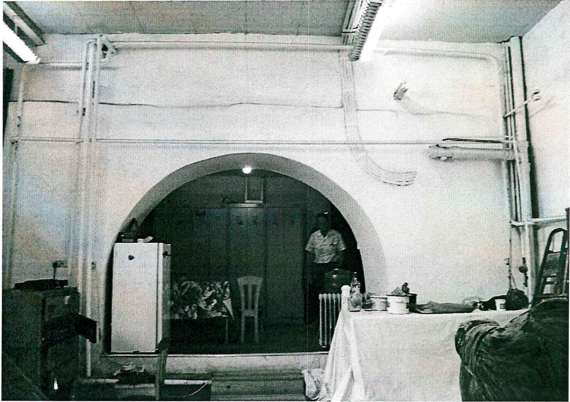
Видовая точка № 7. Помещение юго-восточной части здания (1917 г.). Арочный проем.