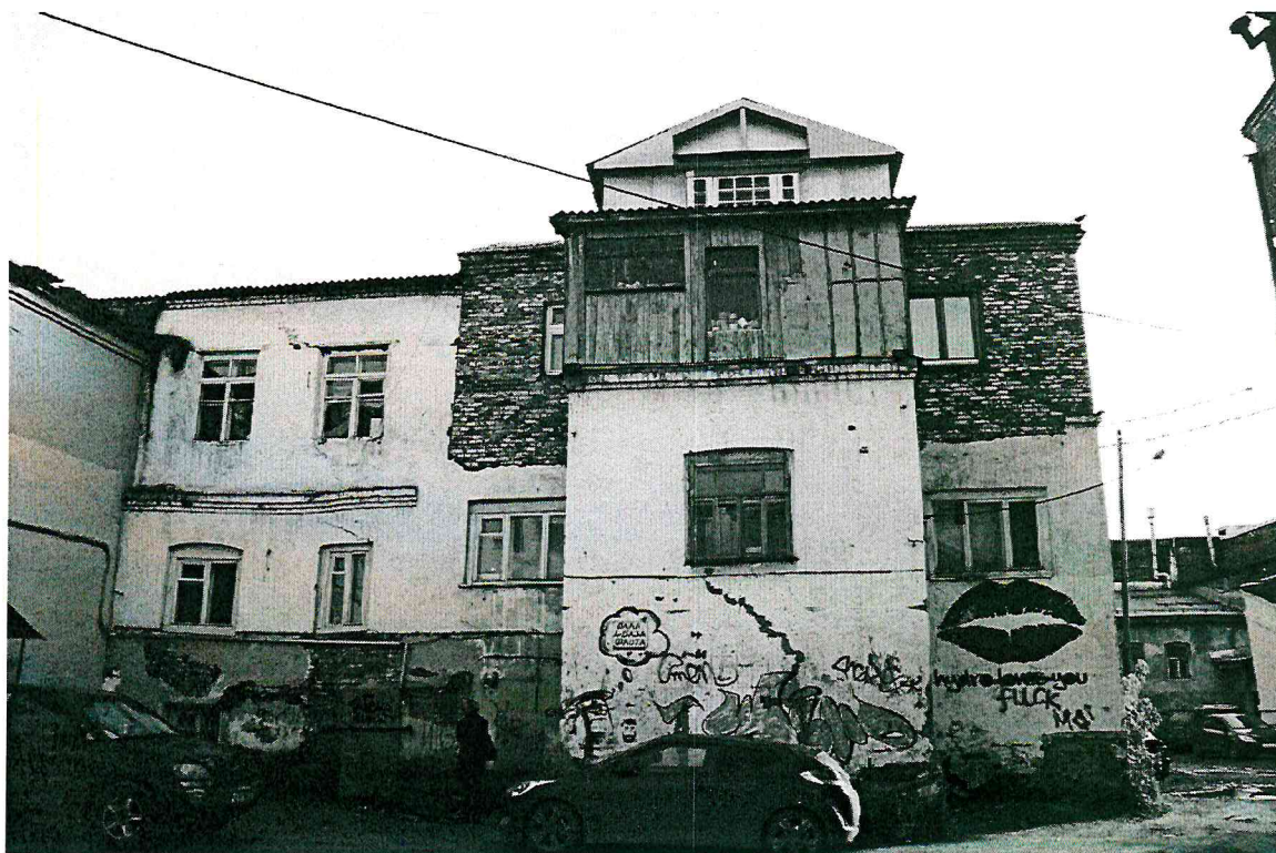
Видовая точка № 4. Северный фасад дворового объема здания (с поздней надстройкой).