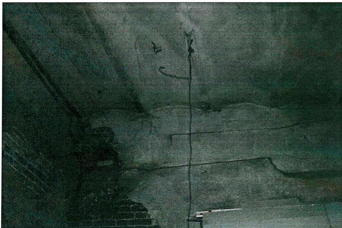
Видовая точка № 6. Помещение с перекрытием из кирпичных сводов по металлическим балкам.