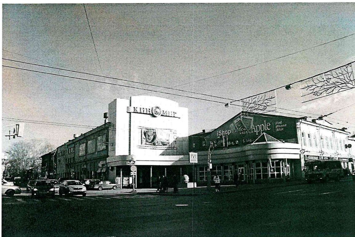
Видовая точка № 1. Общий вид здания с пр. Ленина.

дата съемки: 15.10.2015 г.