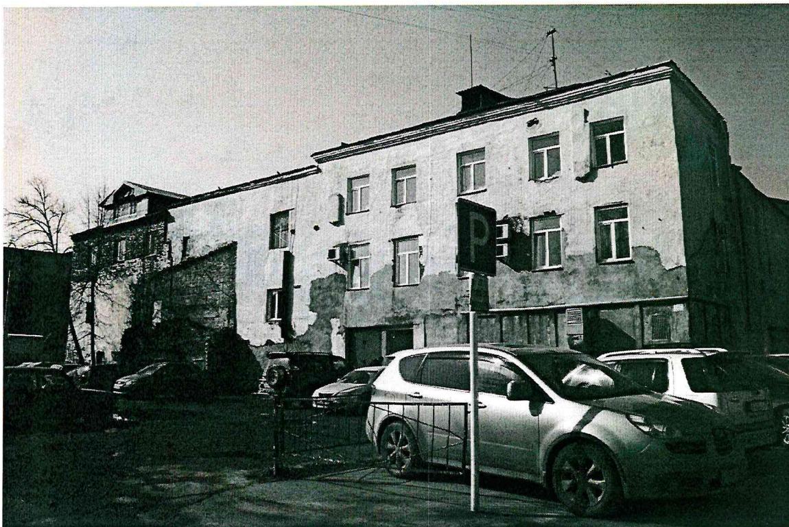
Видовая точка № 5. Южный фасад дворового объема здания. Вид на первоначальный объем (1917 г.).