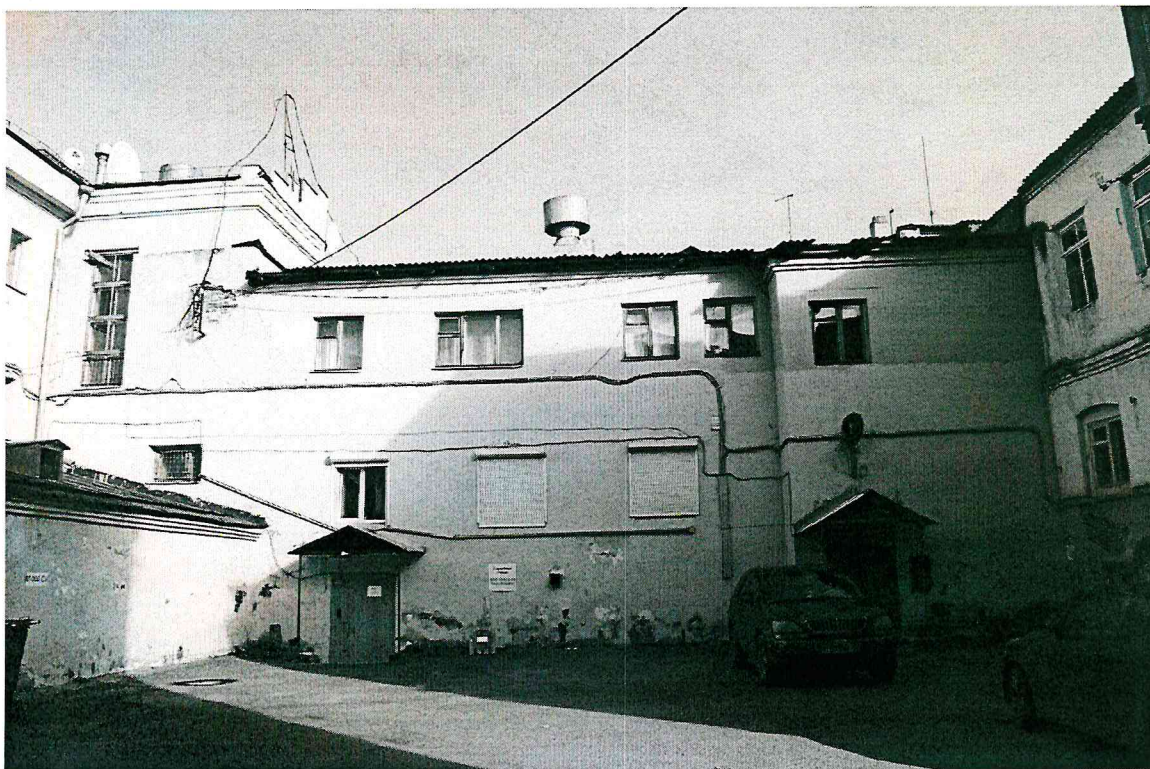
Видовая точка № 3. Западный (дворовый) фасад здания. Вид на первоначальный объем (1917 г.).