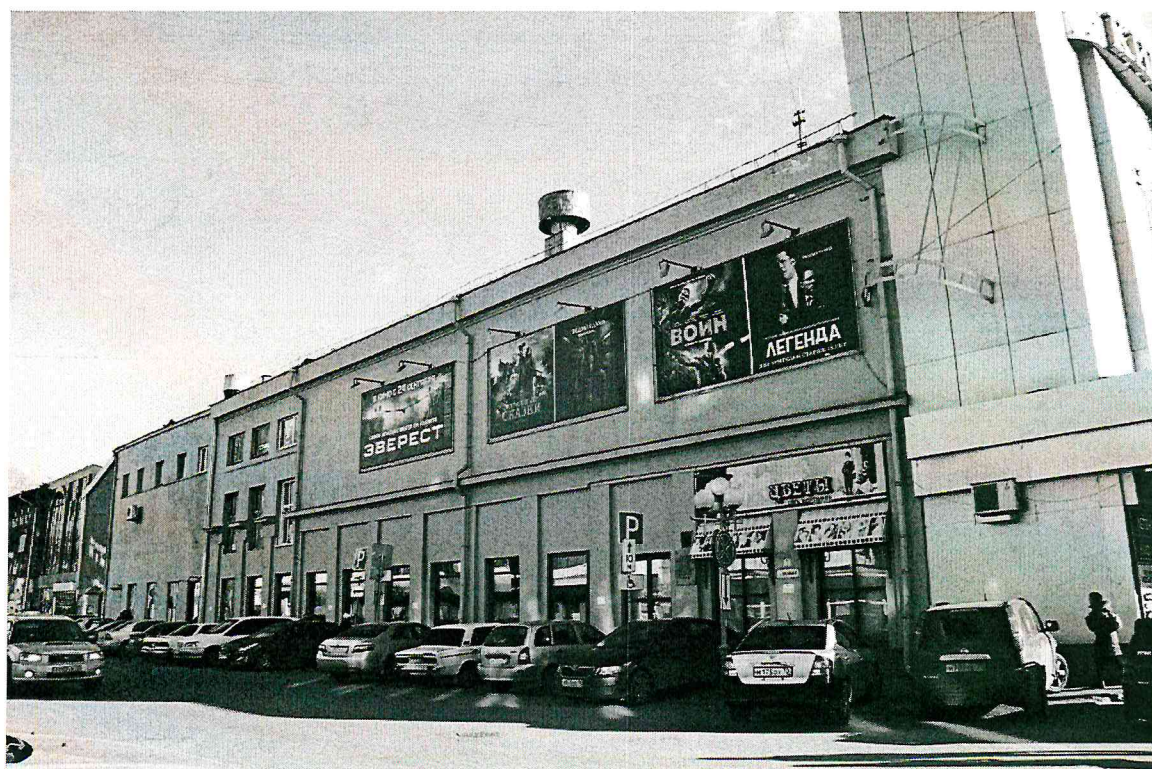
Видовая точка № 2. Северный фасад здания. Вид с пер. Нахановича.