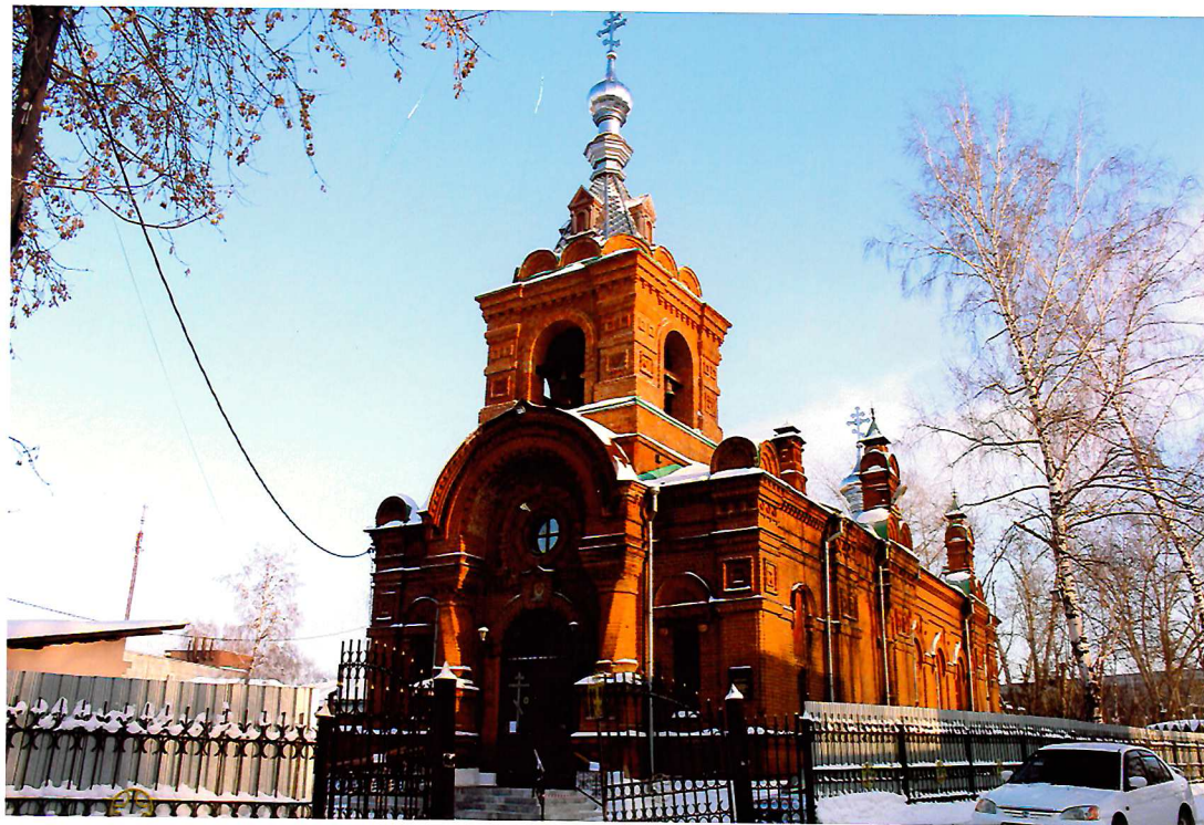
Видовая точка № 1. Общий вид церкви с ул. Центральной.

дата съемки: 22.12.2015 г.