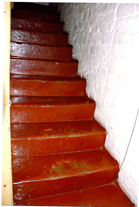
Видовая точка № 17. Лестница из песчаника в северной части притвора.