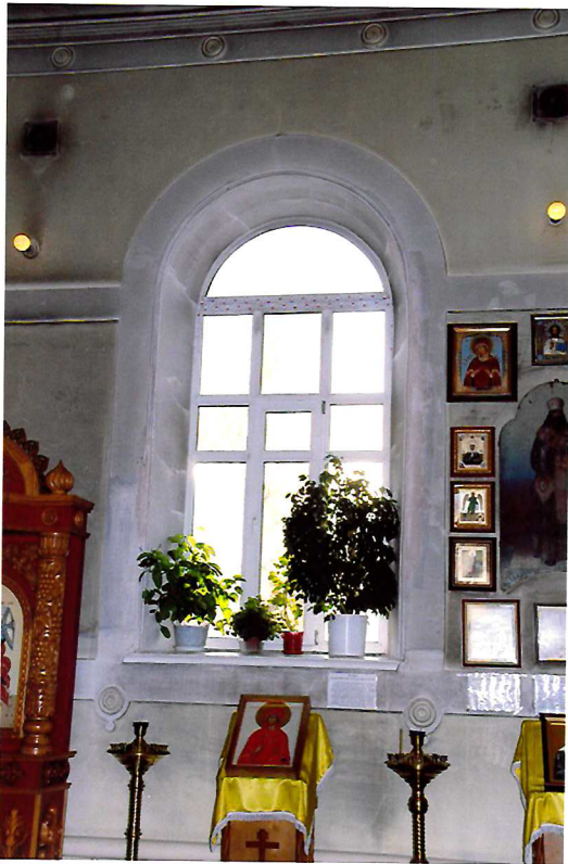
Видовая точка № 14. Арочное окно с лепным декором. Интерьер храмовой части.