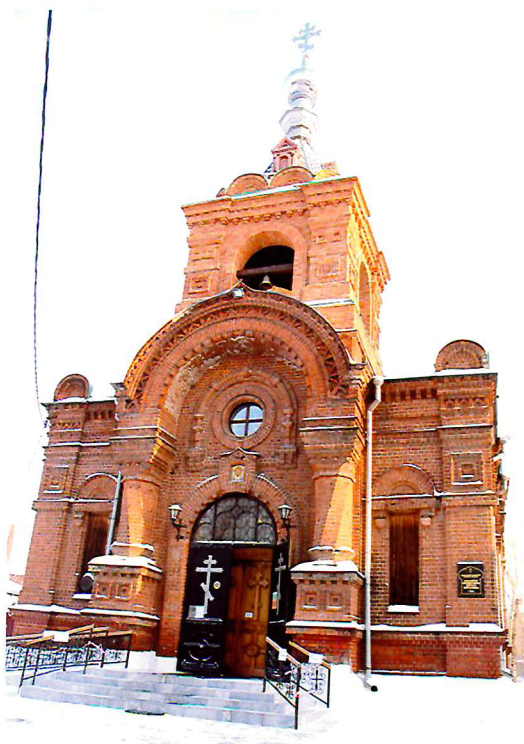
Видовая точка № 4. Главный (западный) фасад церкви.