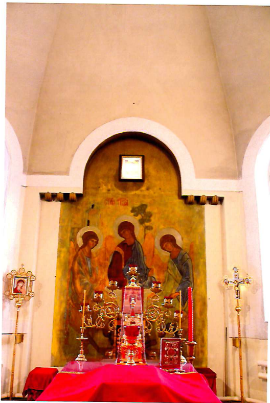
Видовая точка № 16. Помещение алтаря.