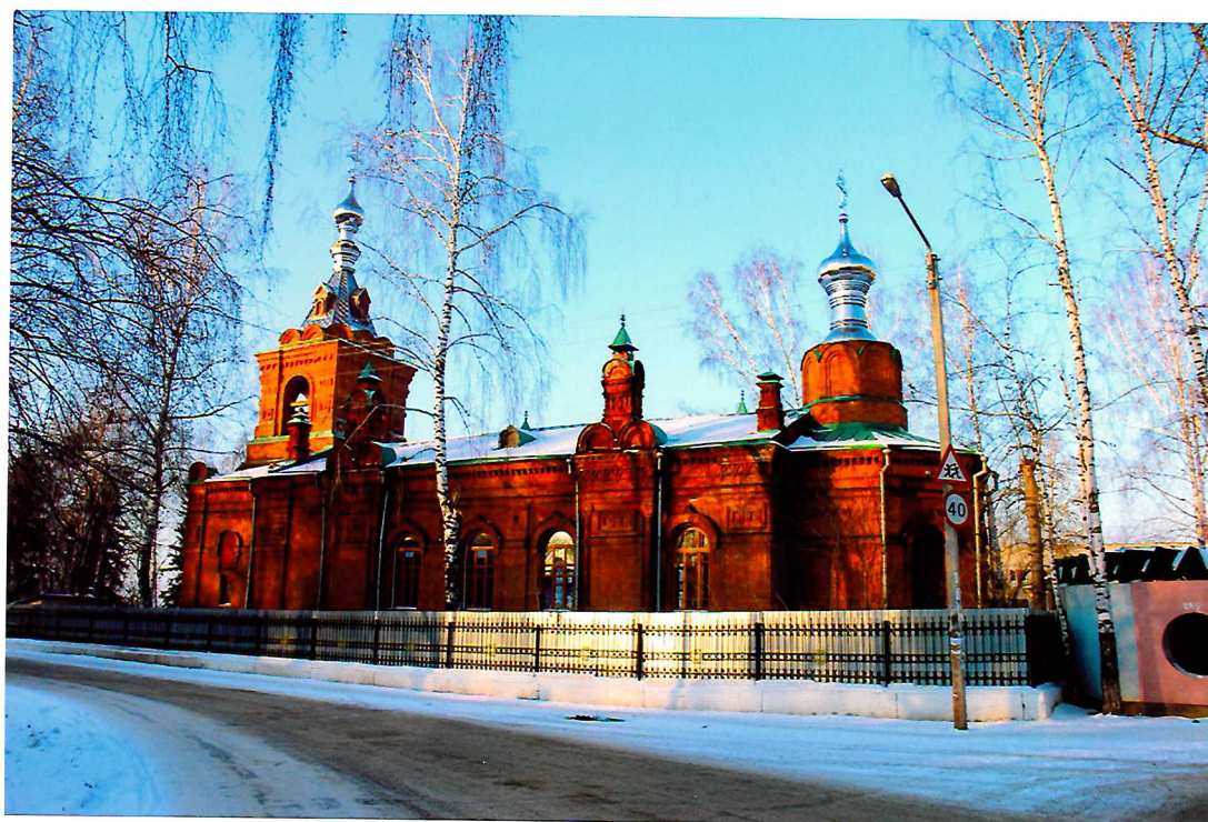
Видовая точка № 2. Южный фасад церкви. Вид с ул. Центральной.