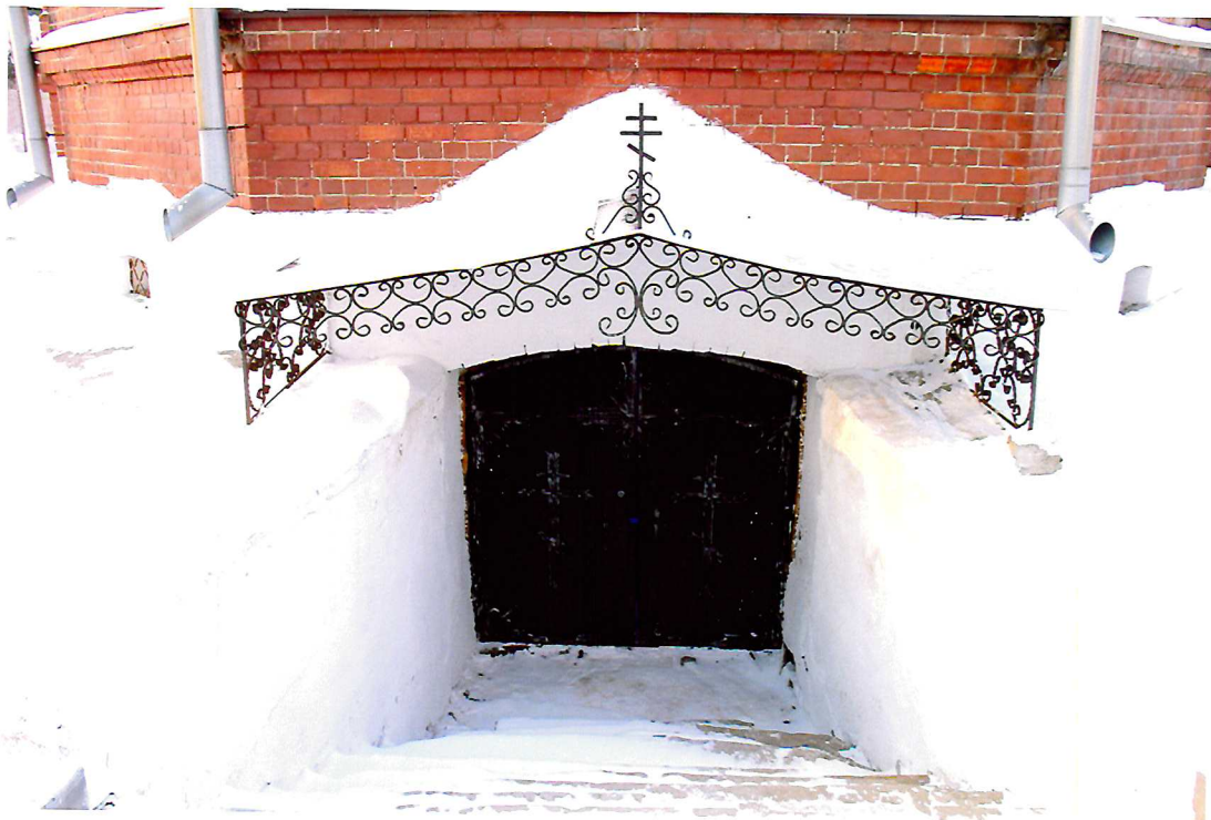
Видовая точка № 8. Вход в склеп. Апсида. Восточный фасад церкви.