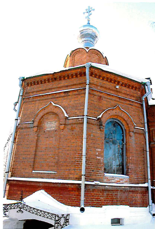
Видовая точка № 5. Общий вид апсиды. Восточный фасад церкви.