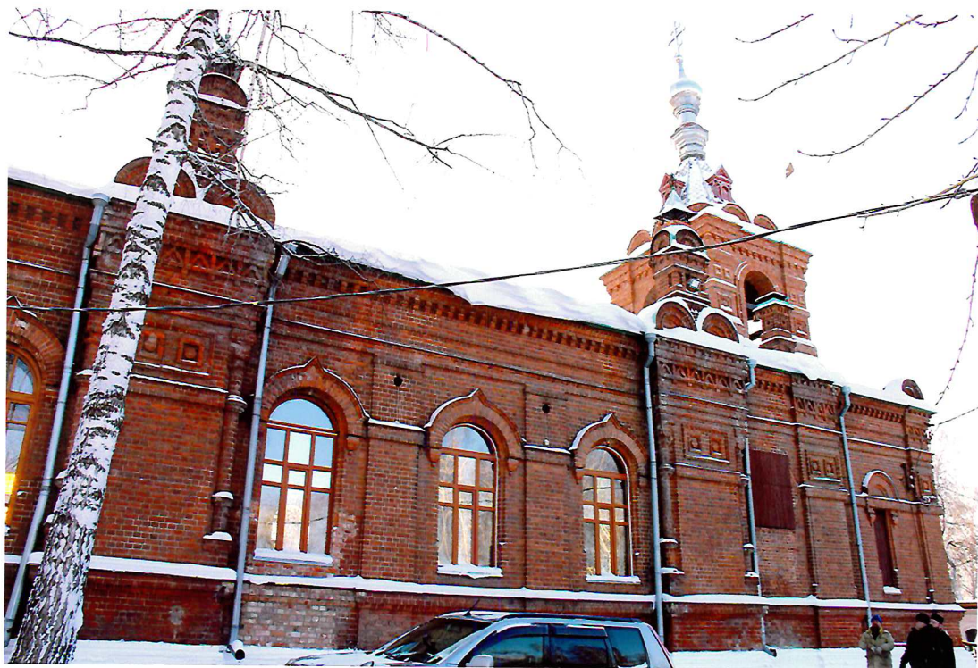
Видовая точка № 3. Северный фасад церкви.