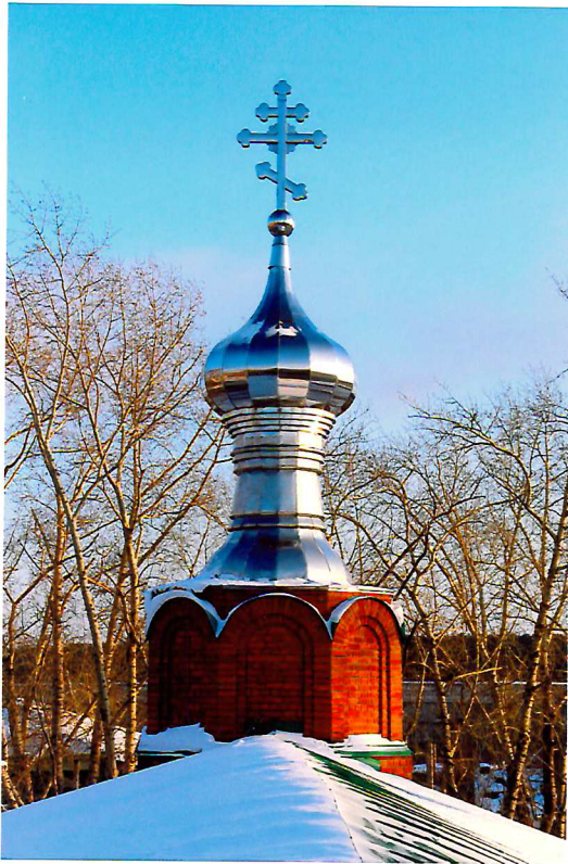
Видовая точка № 9. Восстановленные барабан и главка над апсидой. Вид с колокольни.