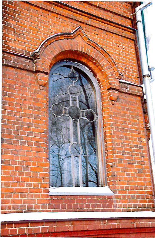
Видовая точка № 6. Арочное окно апсиды. Восточный фасад церкви.