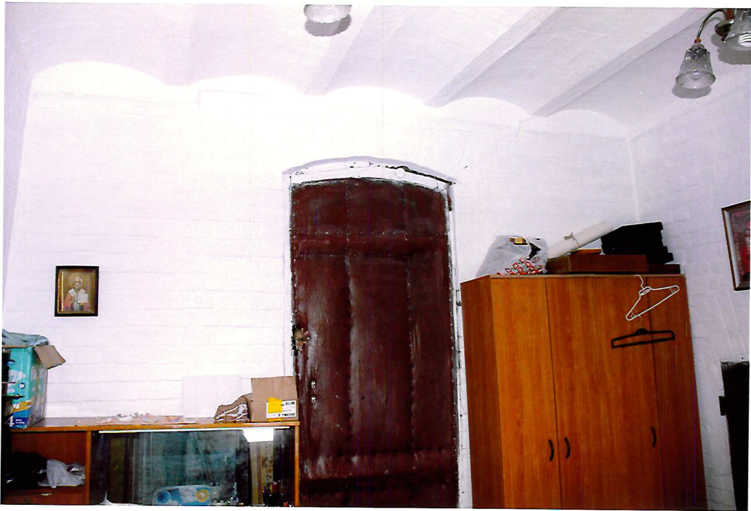
Видовая точка № 18. Помещение под колокольней. Дверной лучковый проём, ведущий на чердак храмовой части.