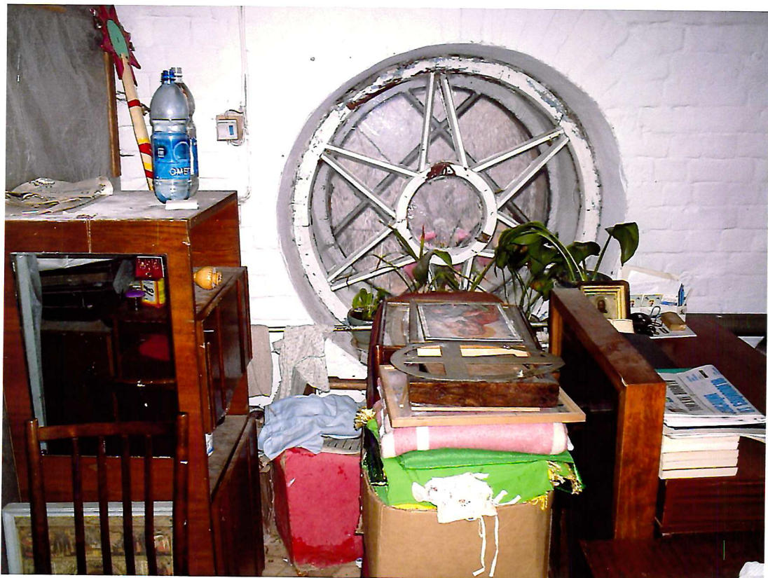
Видовая точка № 19. Помещение под колокольней. Окно круглой формы с расстекловкой в виде 6-ти конечной звезды.