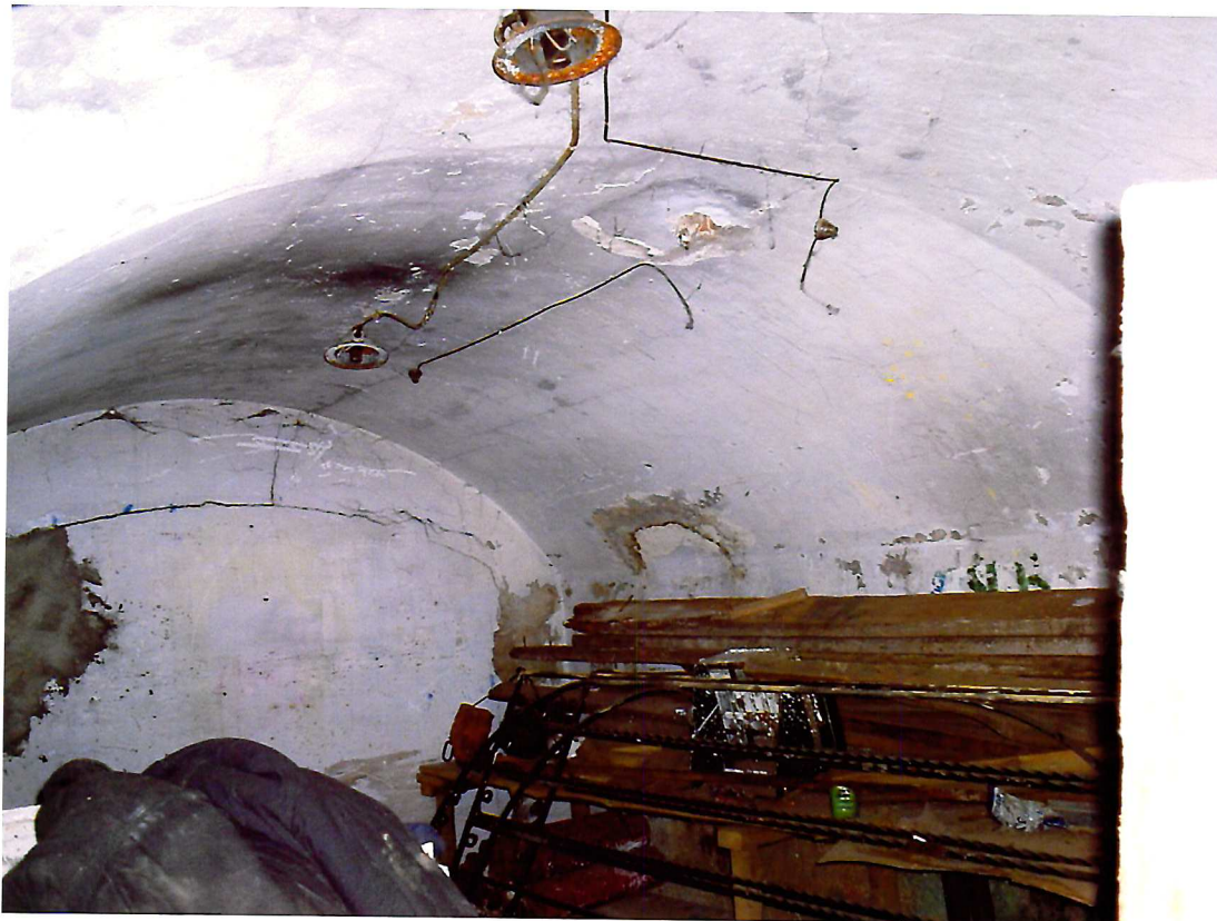
Видовая точка № 11. Цилиндрический свод. Семейный склеп церкви. дата снимка: 25.10.2005 г.