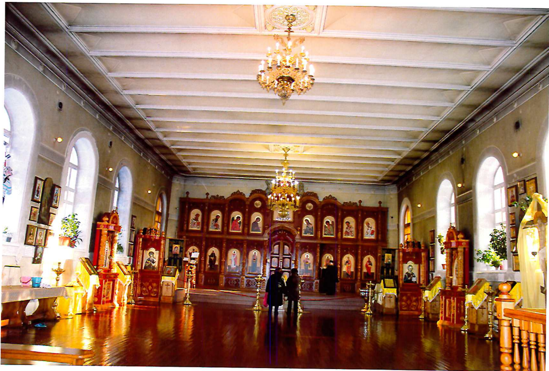
Видовая точка № 13. Общий вид храмовой части церкви