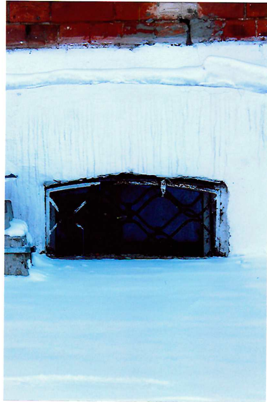
Видовая точка № 7. Окно подвала. Северный фасад церкви.