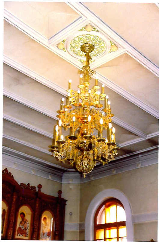
Видовая точка № 15. Лепная розетка в оформлении потолка. Интерьер храмовой части.