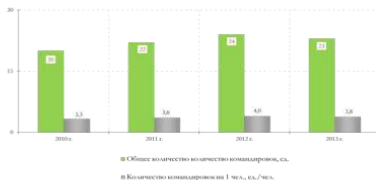
Динамика командировок в отделе лицензирования медицинской и фармацевтической деятельности в 2010-2013 гг.

Количество командировок в 2013 г. составило 23 ед. (без учета г. Томск) (в 2010 г. 20 ед.).