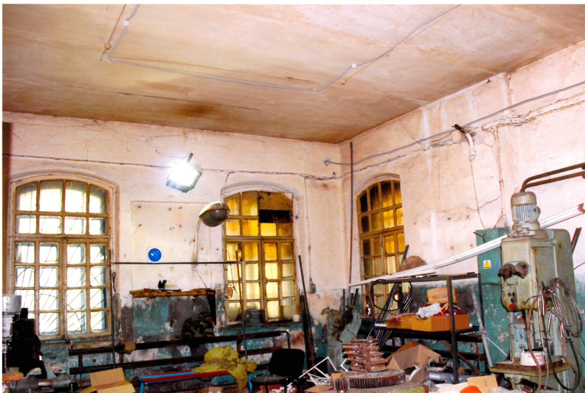
Видовая точка № 6. Фрагмент интерьера здания.