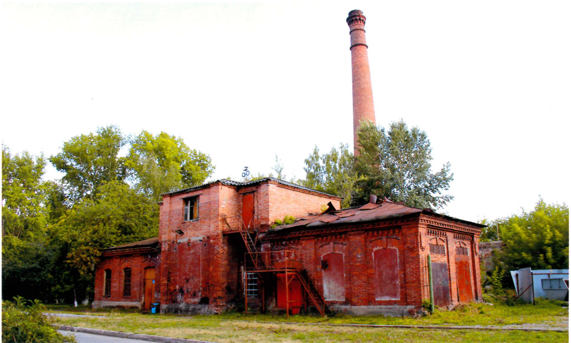
Видовая точка № 1. Общий вид здания с северо-западной стороны.

дата съемки: 15.07.2015 г.