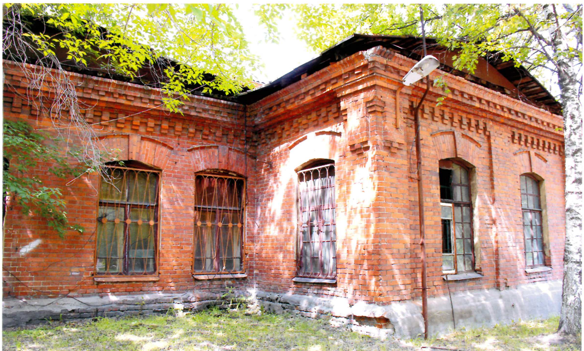
Видовая точка № 2. Общий вид здания с юго-восточной стороны.