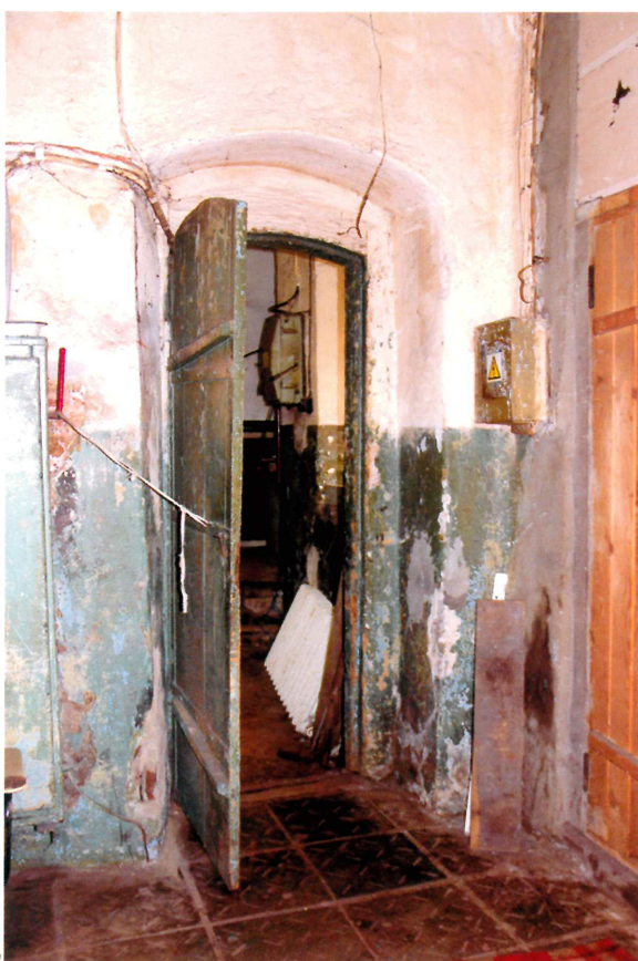
Видовая точка № 7. Внутренняя дверь.