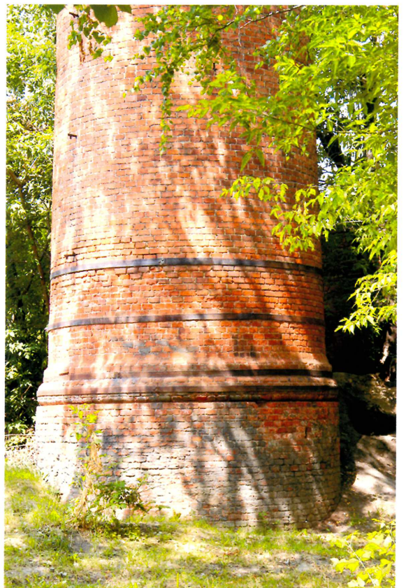
Видовая точка № 11. Кирпичная труба котельной. База.