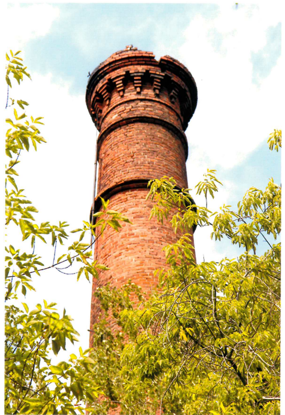
Видовая точка № 10. Декор верхней части трубы.