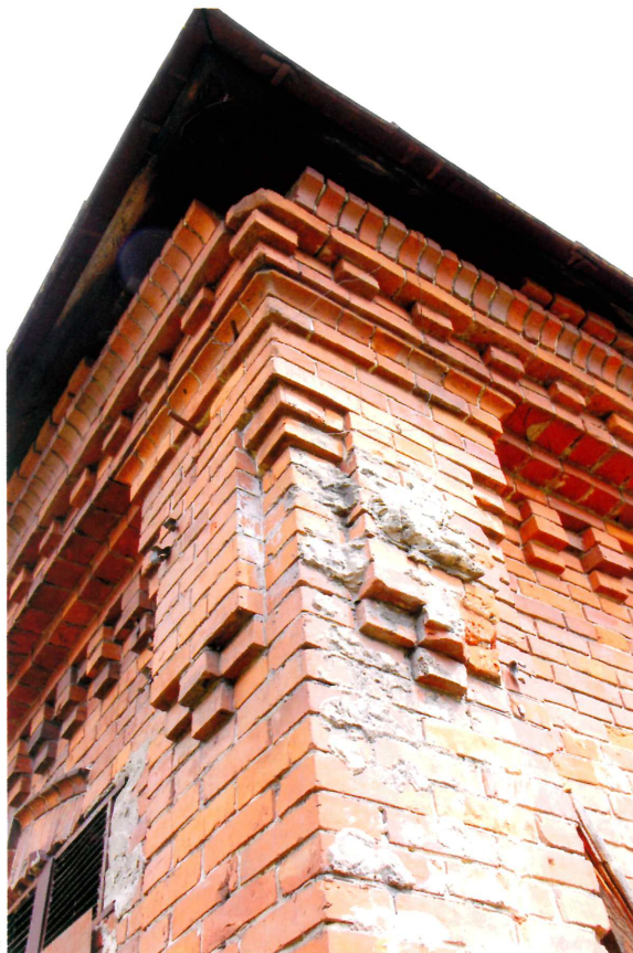
Видовая точка № 4. Фрагмент угловой пилястры.