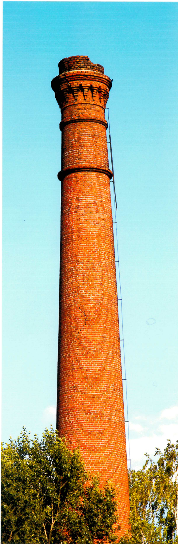
Видовая точка № 9. Кирпичная труба котельной.