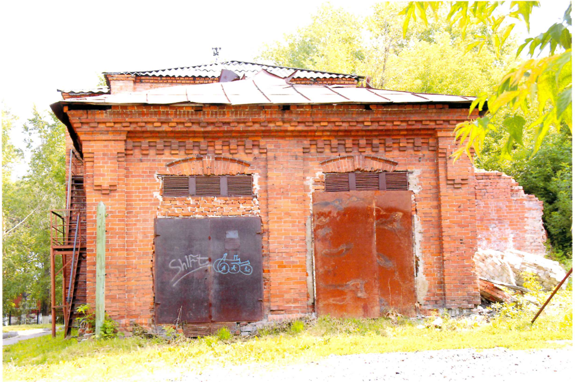
Видовая точка № 3. Западный фасад здания. Вид с дворовой территории ансамбля больницы.