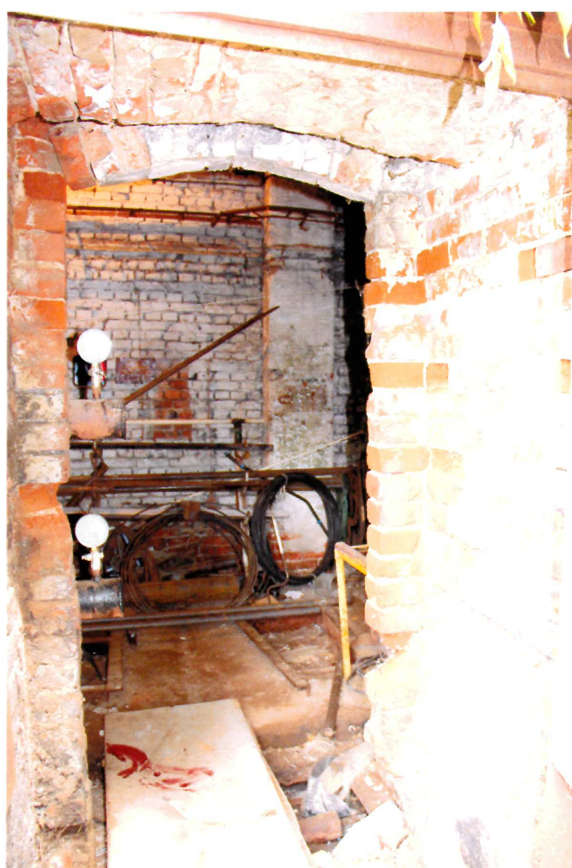
Видовая точка № 8. Дверной проем с лучковой перемычкой.