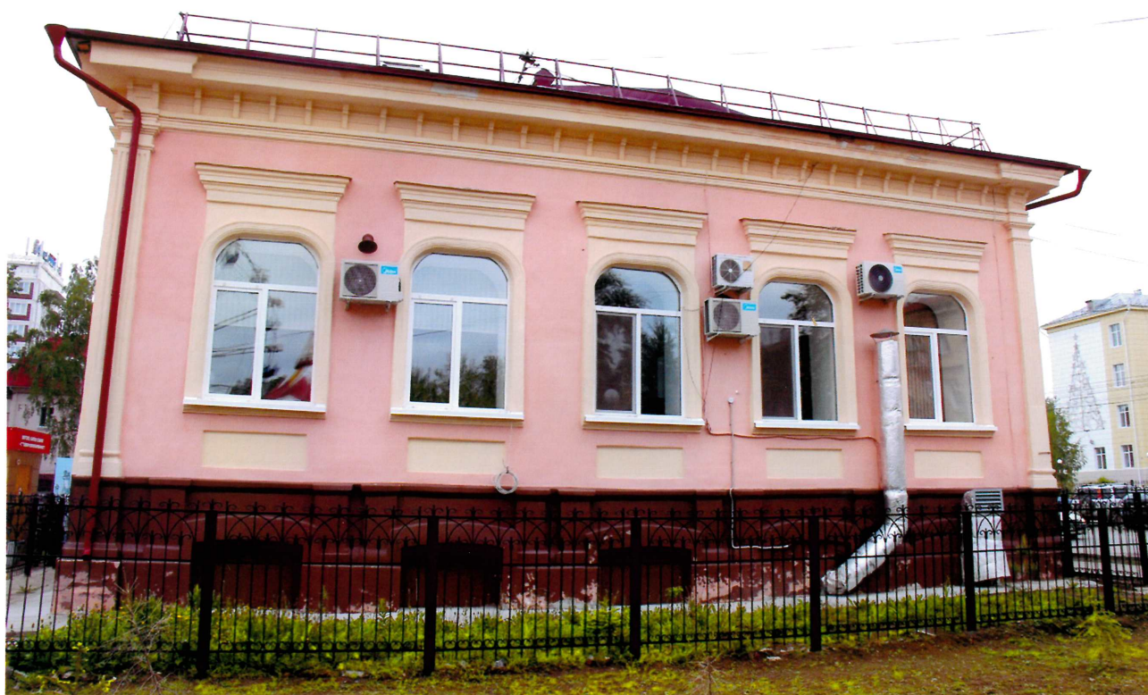
Видовая точка № 3. Западный фасад здания.