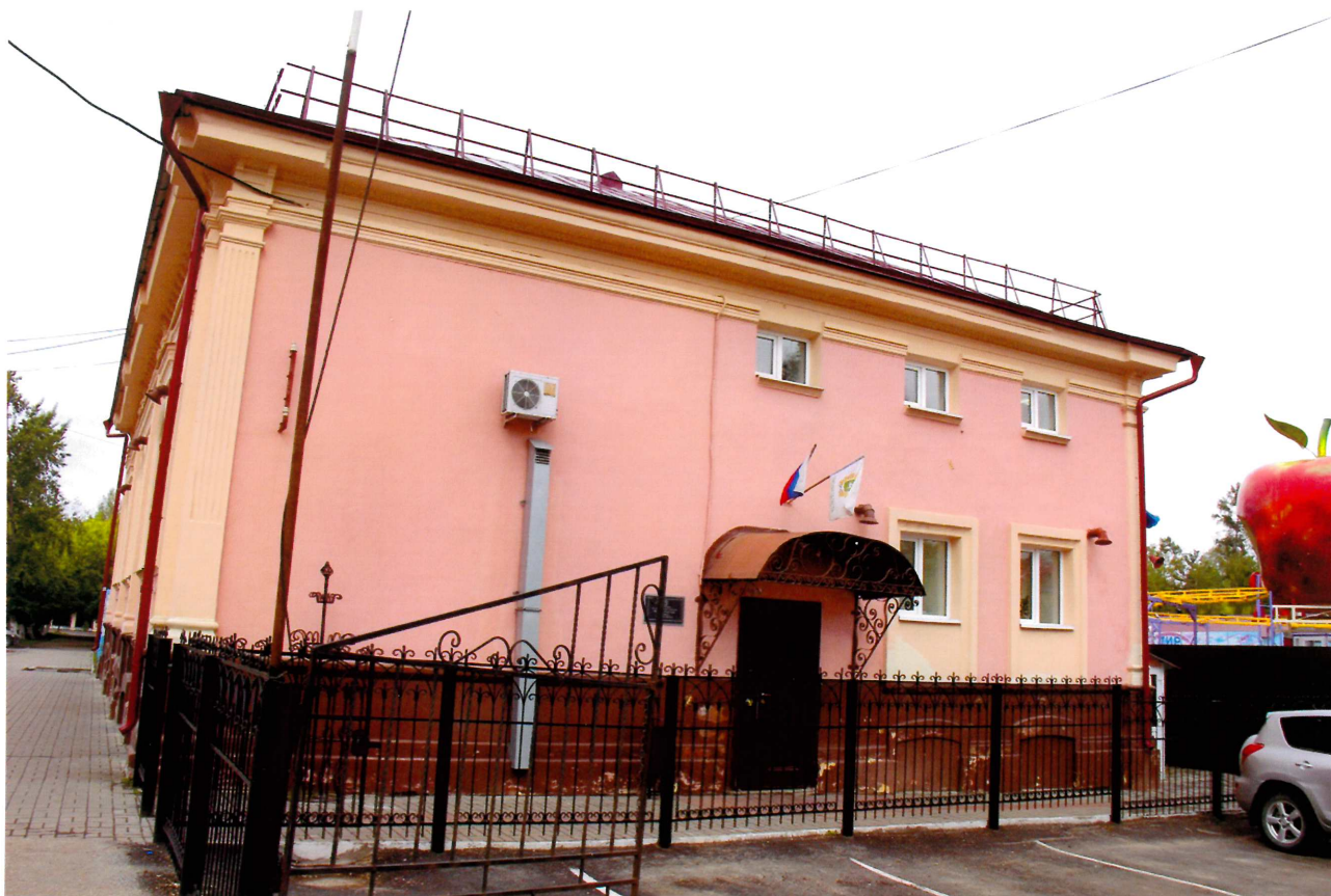
Видовая точка № 5. Восточный фасад здания.