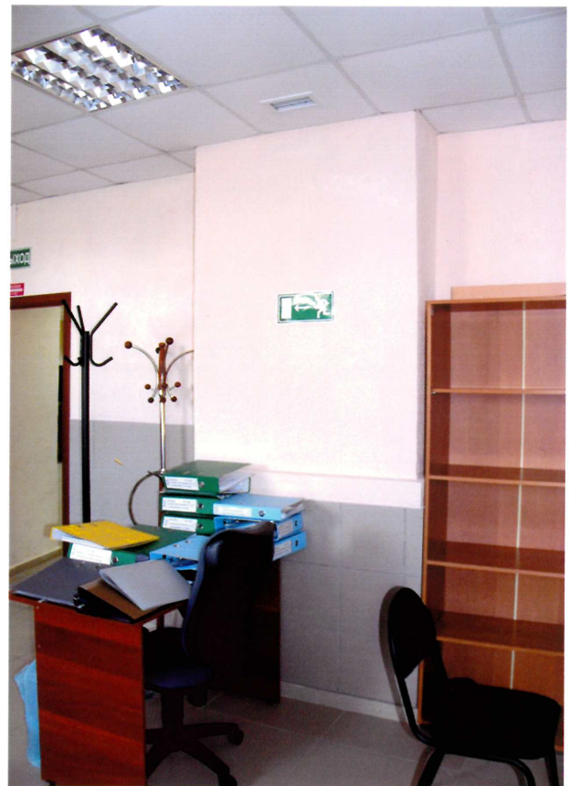
Видовая точка № 11. Голландская стенная прямоугольная печь. Помещение цокольного этажа.