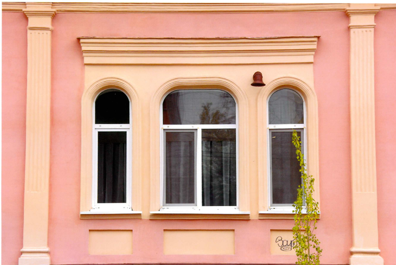
Видовая точка № 7. Тройное окно западного фасада. Декоративные элементы (пилястры, подоконные ниши).