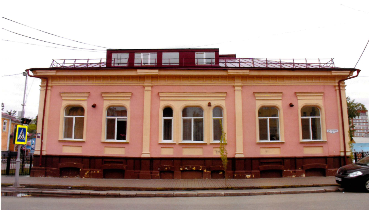
Видовая точка № 2. Главный (южный) фасад здания.