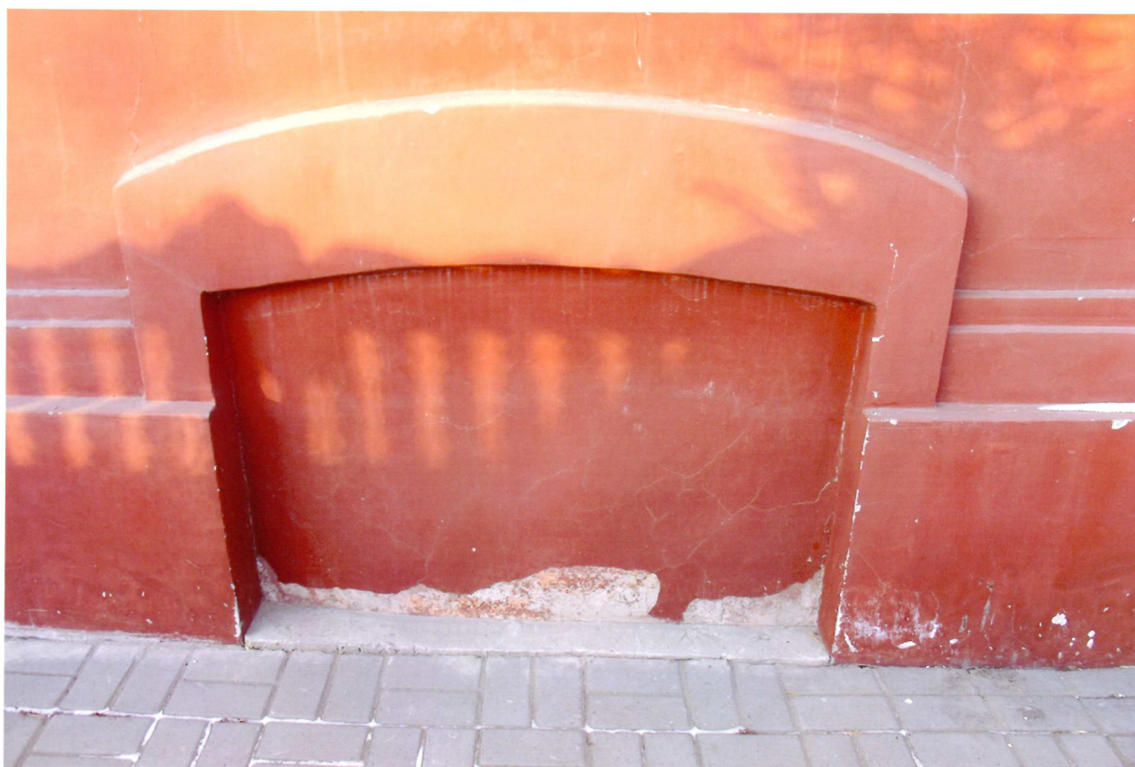
Видовая точка № 6. Оконный проем подвала со стороны восточного фасада.