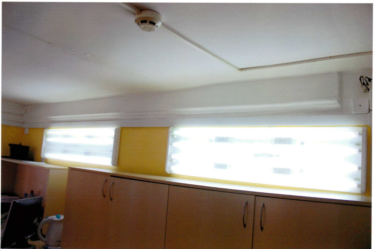
Видовая точка № 12. Потолочно-стенные штукатурные тяги в интерьере помещения мезонина.