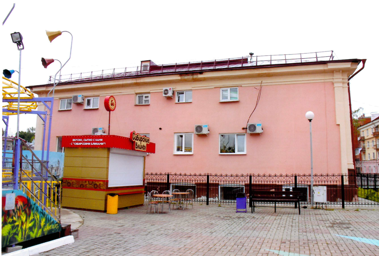
Видовая точка № 4. Северный фасад здания.