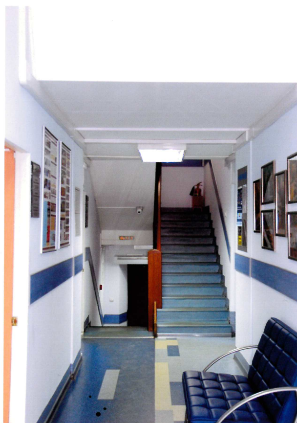
Видовая точка № 9. Вид на лестницу. Коридор 1-го этажа.