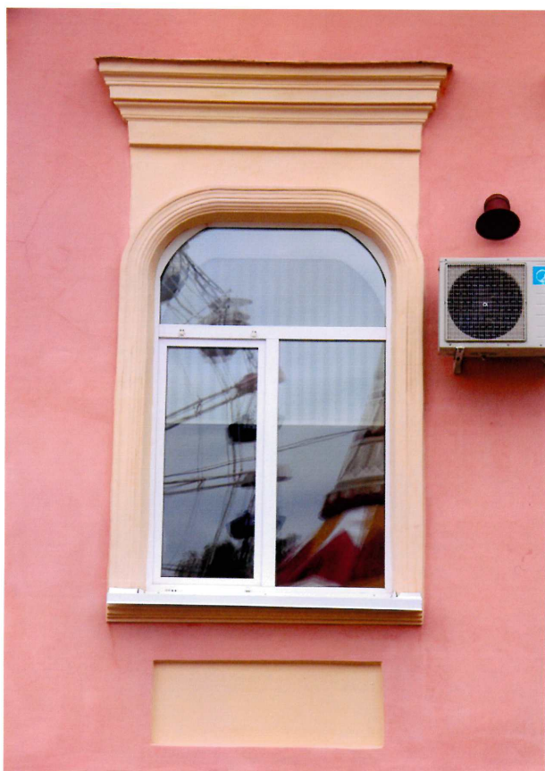
Видовая точка № 8. Арочное окно с закругленными верхними углами. Западный фасад.