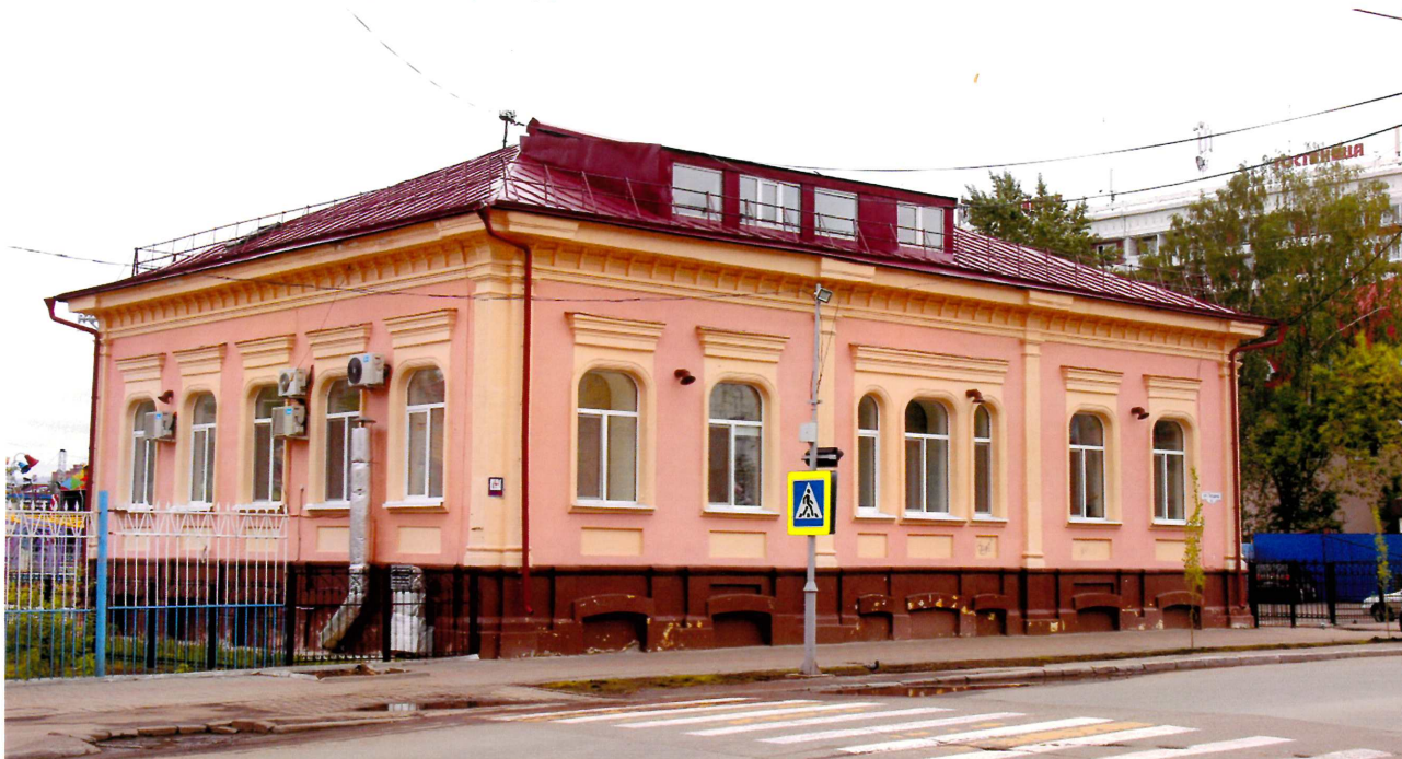
Видовая точка № 1. Общий вид здания с ул. Герцена.

Автор снимков: Архитектор I категории ОГАУК “Центр по охране и использованию памятников истории и культуры” Рыжикова А.Ю., дата: 02.06.2017 г.