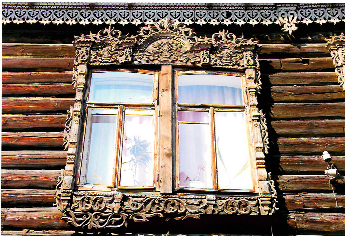
Видовая точка № 9. Наличник 3-х частного окна 2-го этажа южного фасада (окно перестроено).