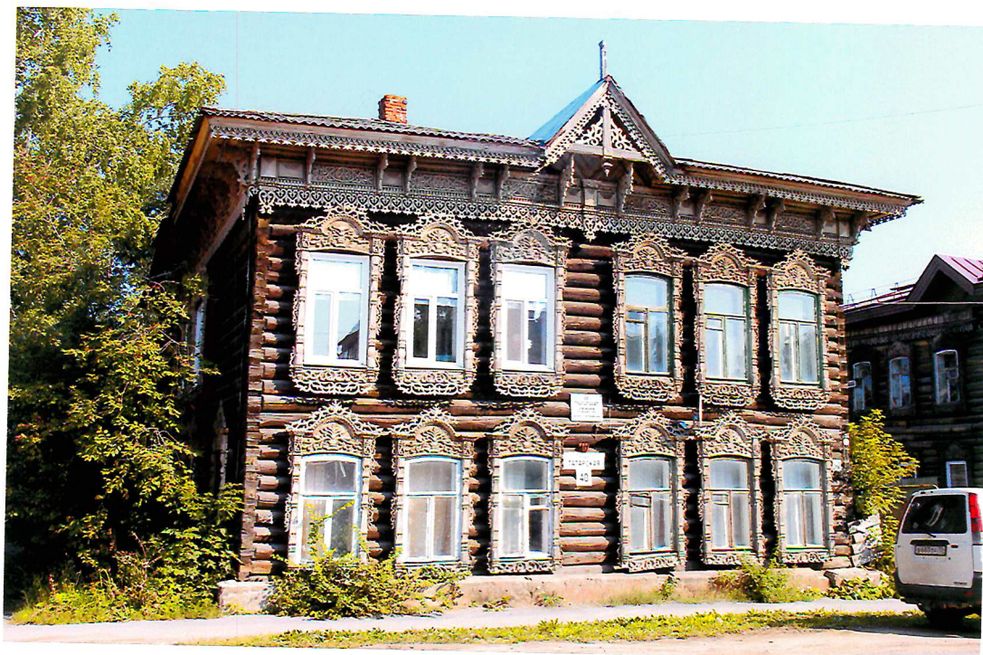
Видовая точка № 2. Главный (западный) фасад здания.