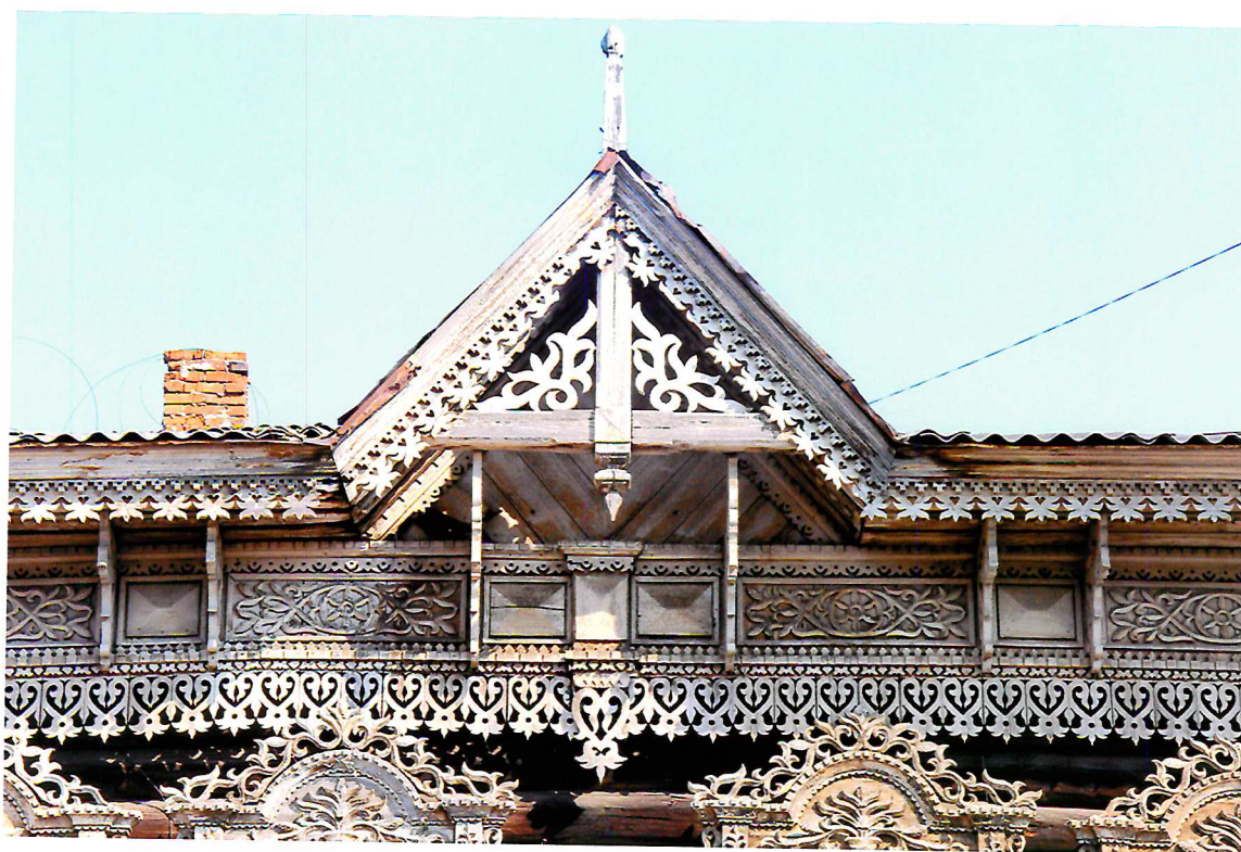
Видовая точка № 4. Фрагмент главного (западного) фасада здания. Треугольный щипец.