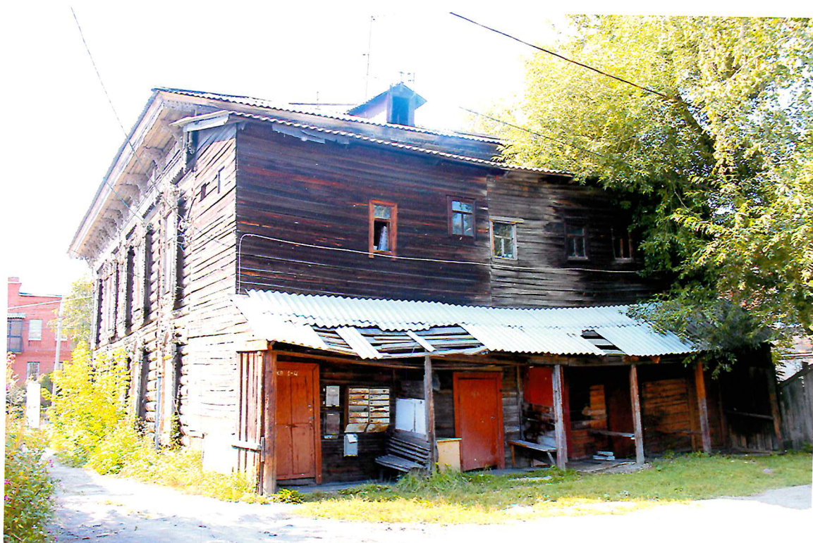
Видовая точка № 6. Восточный (дворовый) фасад здания.