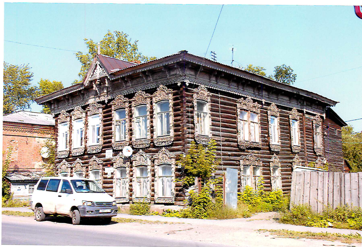
Видовая точка № 3. Общий вид здания с юго-западной стороны.