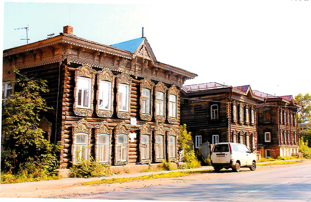
Видовая точка № 1. Общий вид здания в строчке застройки по ул. Татарской.

Автор снимков: начальник отдела научного учета ОКН (памятников истории и культуры) ОГАУК «Центр по охране памятников» Яблонская М.А., дата съемки: 26.08.2016 г.