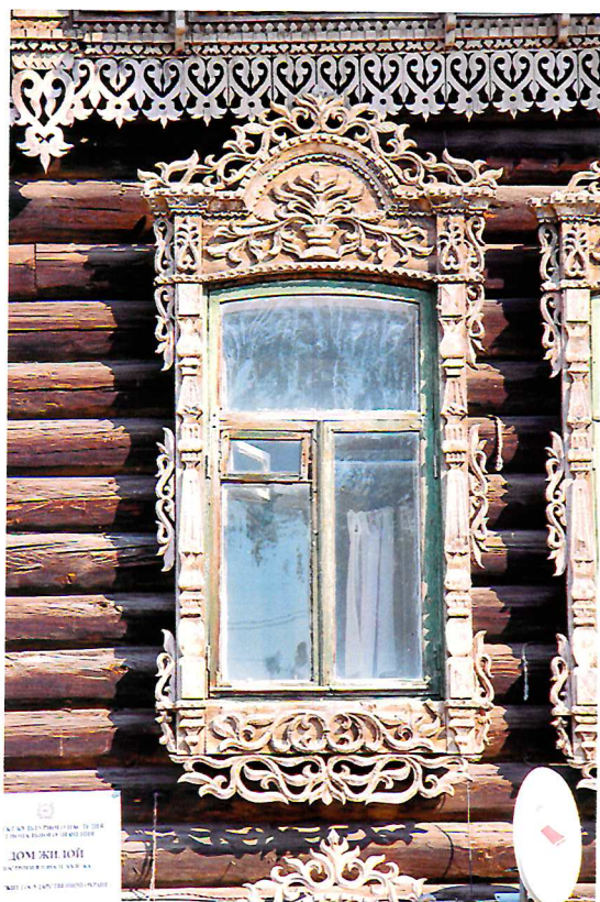
Видовая точка № 10. Окно 2-го этажа главного фасада.