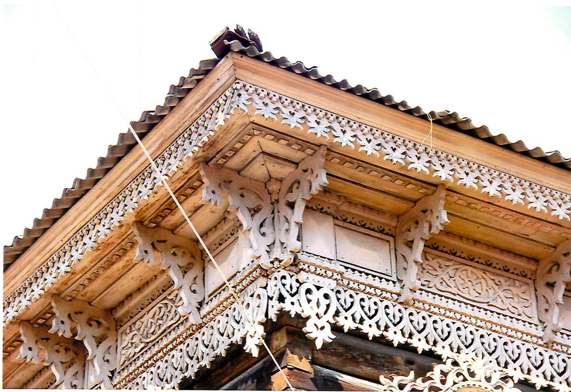
Видовая точка № 7. Фрагмент декоративного оформления карниза здания.