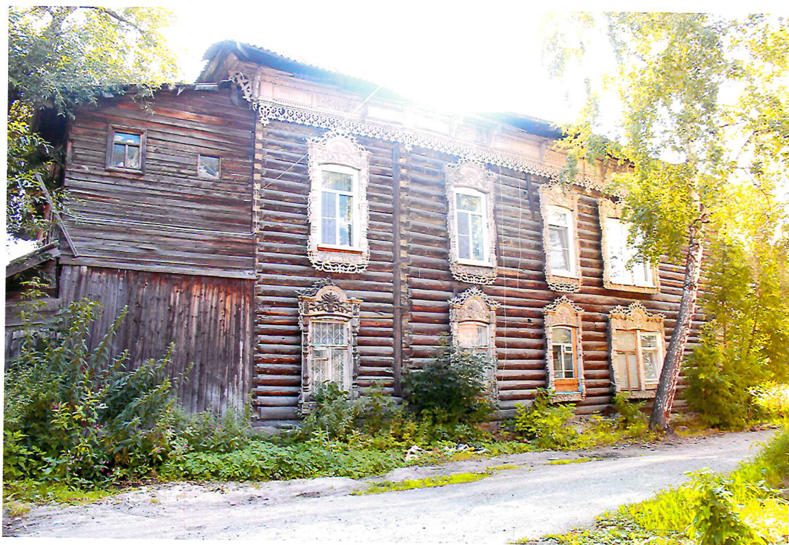
Видовая точка № 5. Северный фасад здания.